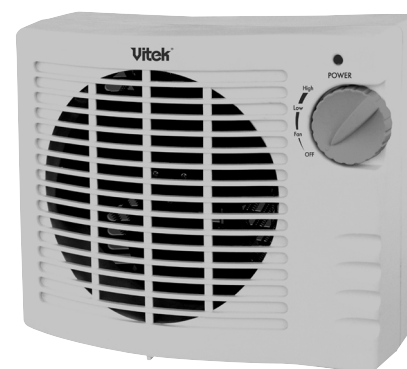
TABLE TOP HEATER ТЕПЛОВЕНТИЛЯТОР